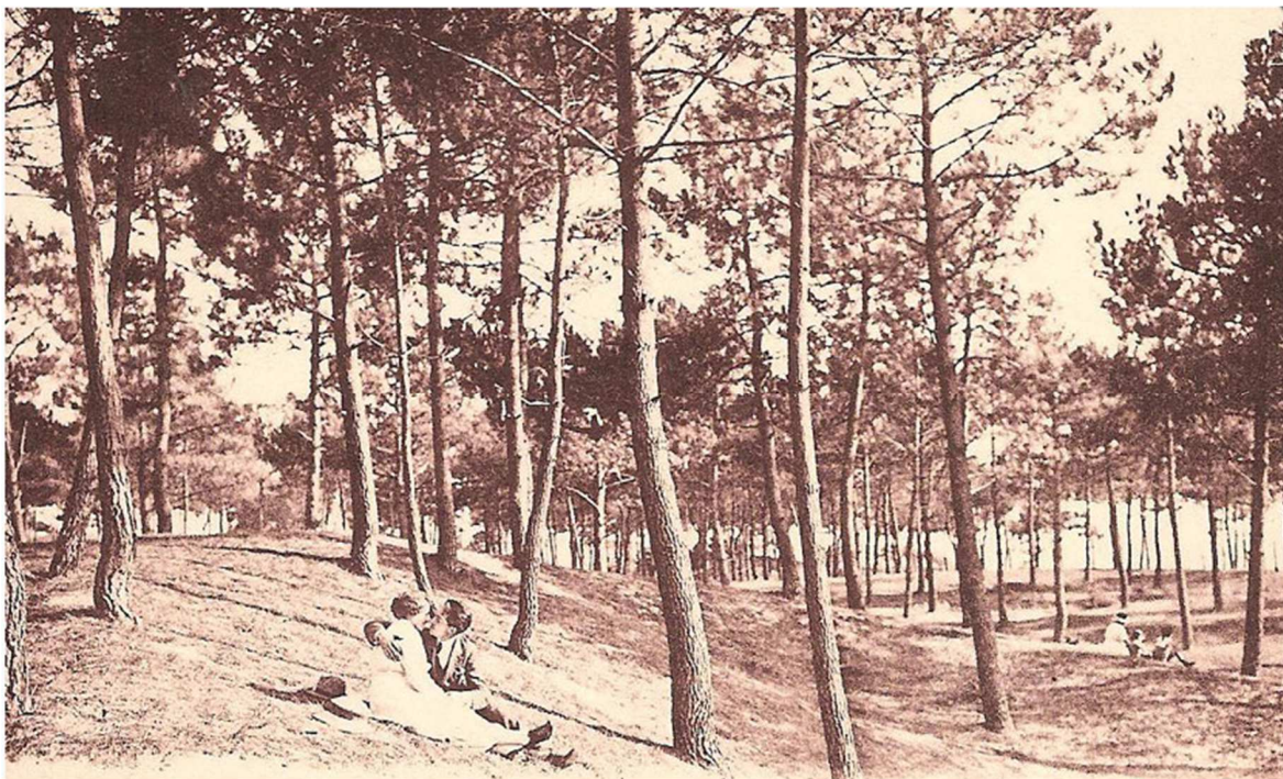
Les plantations du bois d'amour