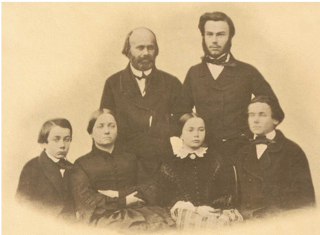
Reproduction d'un daguerréotype de 1855